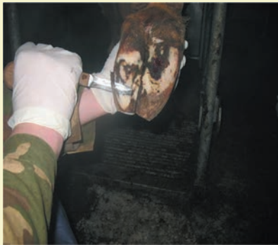
Фото 5. Срезание рога подошвы