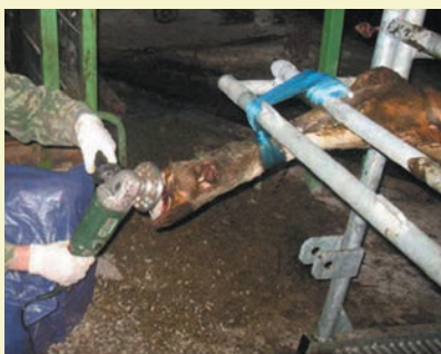
Фото 2. Расчистка копытцев с помощью электрофрезы