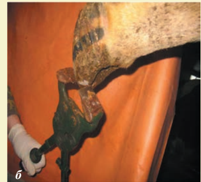
Фото 3. Расчистка внутреннего копытца: а — снятие мерки; б — укорачивание несущей стенки