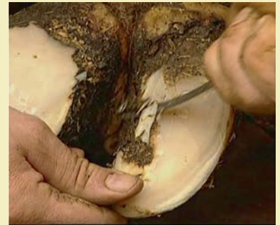
Фото 6. Функциональная расчистка копытец

На комплексах, где нет стационарных ванн, используют переносные емкости, которые зачастую не соответствуют физиологическим потребностям животных. Коровы очень чувствительны к различным недостаткам ванн: даже небольшие прогибы, ребра на дне, высокие борта, вибрация могут стать причиной стресса.