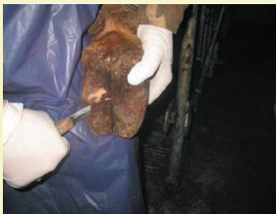
Фото 1. Расчистка копытцев в фиксационном станке

При помощи ножа срезают рог подошвенной части таким образом, чтобы образовалась большая площадь опоры. Для постепенного достижения нужного