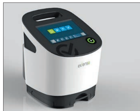
Модули системы EXTENSO

нантов в пробе сырого молока. Система объединяет усовершенствованные формы известных способов измерения — биологического, фотоэлектрического и иммунохроматографического.