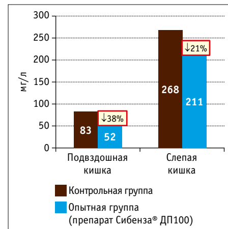
Рис. 1. Концентрация неусвоенного протеина в толстом кишечнике поросят

В послеотъемный период, особенно в течение первой недели, поросята потребляют мало корма и медленно растут.