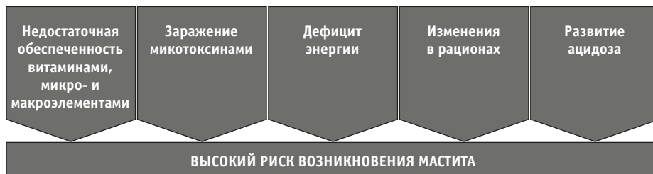
Рис. 1. Факторы кормления, повышающие риск возникновения мастита у дойной коровы

Исследования показали: слой клеток эпидермиса в сосковом канале истончается в том случае, когда корова потребляет корм с низким содержанием