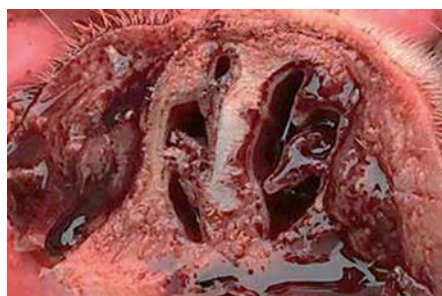
Фото 4. Носовые раковины поросенка невакцинированной группы

Компания «Ветпром» 117218, Москва, ул. Б. Черемушкинская, д. 28 Тел./факс: +7 (499) 702-50-77 E-mail: vetprom@vetprom.ru www.vetprom.ru