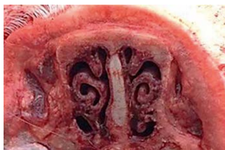
Фото 2. Носовые раковины поросенка вакцинированной группы