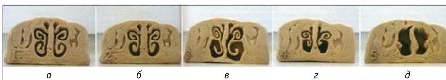
Используемая в Коре морфометрическая шкала для определения интенсивности изменений в носовых пазухах свиней:

Результаты исследований на кроликах показали, что при применении препарата РиниПиг титр антител значительно превышает аналогичный показатель в случае иммунизации другими вакцинами (табл. 1).