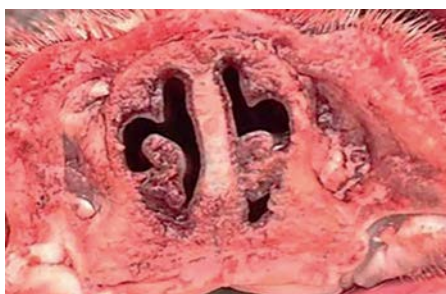
Фото 3. Носовые раковины поросенка невакцинированной группы