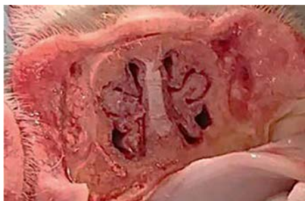
Фото 1. Носовые раковины поросенка контрольной группы

Иммунизация свиней препаратом РиниПиг способствует профилактике атрофического ринита и позволяет защитить поголовье от респираторных инфекций в течение всего периода выращивания (вплоть до убоя). Благодаря этому рентабельность хозяйств повышается. ЖР