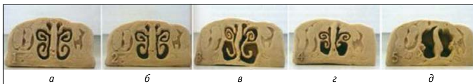
Используемая в Коре морфометрическая шкала для определения интенсивности изменений в носовых пазухах свиней:

Результаты исследований на кроликах показали, что при применении препарата РиниПиг титр антител значительно превышает аналогичный показатель в случае иммунизации другими вакцинами (табл. 1).