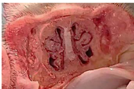
Фото 1. Носовые раковины поросенка контрольной группы

Иммунизация свиней препаратом РиниПиг способствует профилактике атрофического ринита и позволяет защитить поголовье от респираторных инфекций в течение всего периода выращивания (вплоть до убоя). Благодаря этому рентабельность хозяйств повышается. ЖР