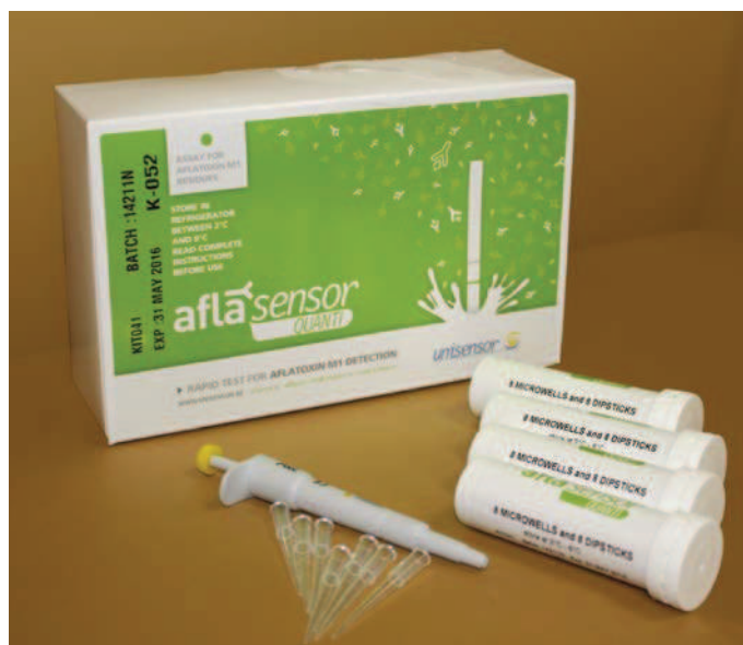
Тест-набор для выявления афлатоксина М1 в пробах сырого и пастеризованного молока

МЕТОД ВЫЯВЛЕНИЯ АФЛАТОКСИНА М1 С ИСПОЛЬЗОВАНИЕМ ТЕСТ-НАБОРА AFLASENSOR M1 ВНЕСЕН В ПРОЕКТ ГОСТА «МОЛОКО И МОЛОЧНАЯ ПРОДУКЦИЯ. ЭКСПРЕСС-МЕТОД ОПРЕДЕЛЕНИЯ АФЛАТОКСИНА М1».