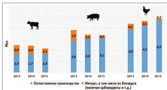
Рис. 1. Доля отраслей на рынке мяса в РФ

Инвестиционная конъюнктура ухудшилась в 2015 г., после резкого роста ключевой ставки и соответствующего удорожания кредитов. Фактически новых крупных проектов в мясном животноводстве не предвидится. Все вложения в строительство дополнительных мощностей делают уже дей-