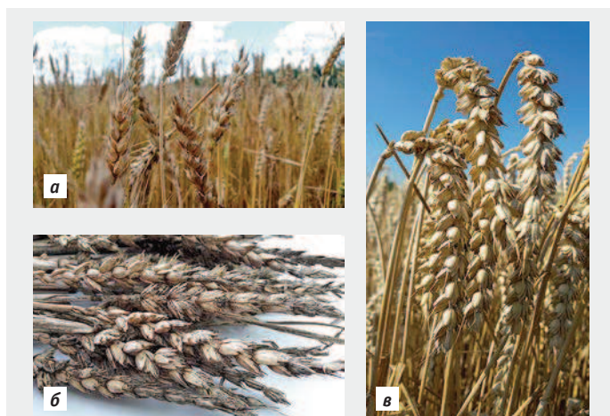
Пшеница перед сбором урожая, 2017 г.: а — в России, б — в Великобритании, в — в Словакии