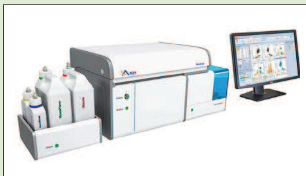
Рис. 2. Проточный цитометр NovoCyte 2000