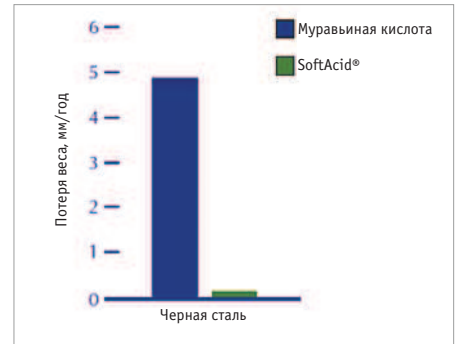
Рис. 1. Коррозионная стойкость железа (результаты получены в SINTEF, Норвегия, 2003)

Чтобы увеличить масштабы применения органических кислот в кормах, необходима улучшенная форма вещества — некоррозивная, безопасная, действенная и простая в применении. Животноводы, использующие органические кислоты, не должны делать выбор между безопасностью и эффективностью продукта.