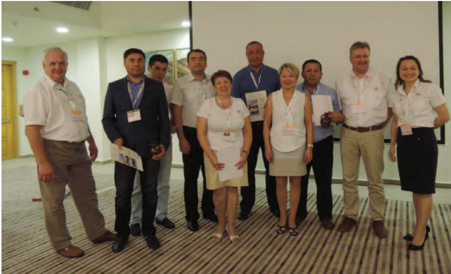
Представители птицефабрик Узбекистана после награждения