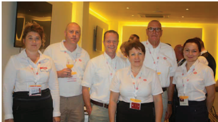
Технические специалисты Cobb