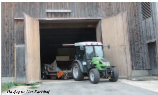
На ферме Gut Karlshof