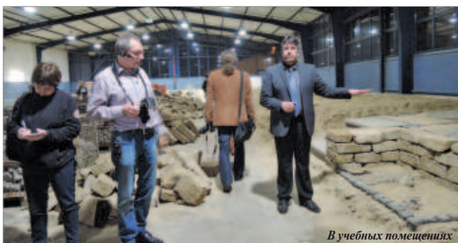
В учебных помещениях