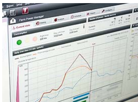
Компьютерная программа управления фермой FarmPowerManager

Концепция «Ферма-2030» была продемонстрирована в реальном масштабе на модели, размещенной на площади 500 м 2 . Этот стенд стал местом встречи специалистов свиноводческой отрасли.