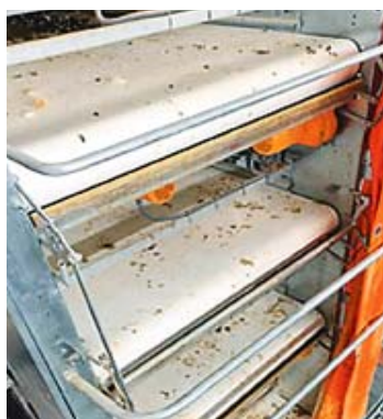
Система автоматического контроля и управления лентами пометоудаления в птичниках для содержания кур-несушек

Серебряная медаль присуждена за инновационную автоматическую систему управления лентами линий пометоудаления в помещениях для содержания кур-несушек. Новая технология обеспечивает очень бережное обращение с птицей, экономит время и значительно уменьшает износ лент транспортера. Установленные на них датчики автоматически распознают отклонения в движении и подают сигнал о необходимости корректировки. При сильных колебаниях машина будет приведена в безопасное состояние. Новую систему можно использовать при всех способах содержания птицы.