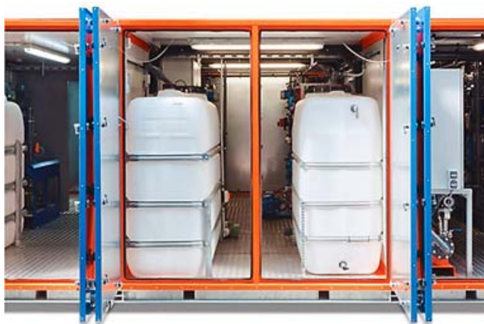
Система мембранной фильтрации MemFis

Интерес к выставке EuroTier со стороны российских животноводов постоянно растет. За последние годы они вышли на качественно новый уровень производства, который зачастую не только соответствует лучшим мировым стандартам, но и превосходит их. Очень важен для специалистов обмен опытом с европейскими коллегами: именно они первыми примеряют на своих хозяйствах большинство новинок, представленных на EuroTier.